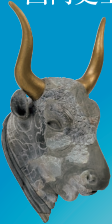
牛頭形リュトン 前1450年頃 イラクリオン考古学博物館蔵