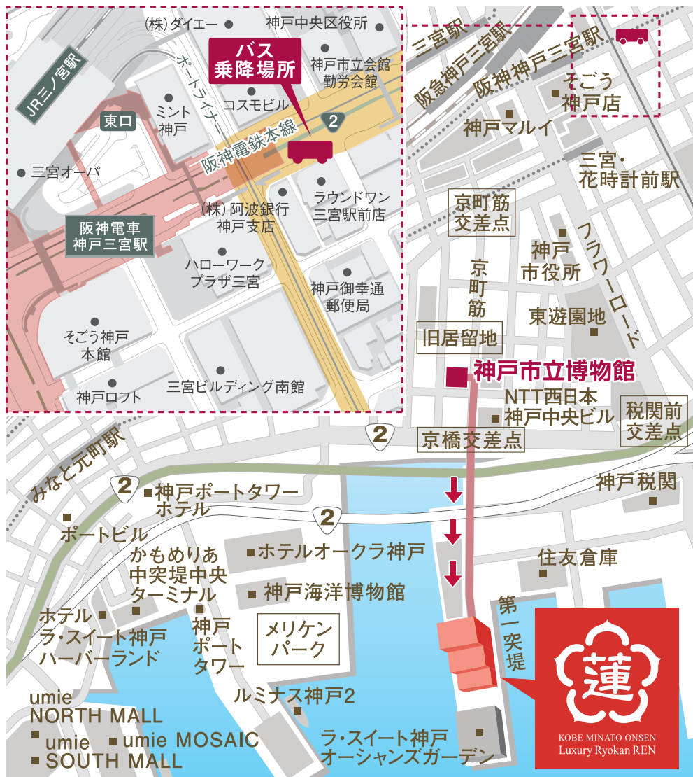
[時刻表] 三宮駅前発 → 神戸みなと温泉 蓮